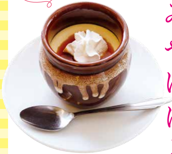
幸せの壺プリン (プレーン)