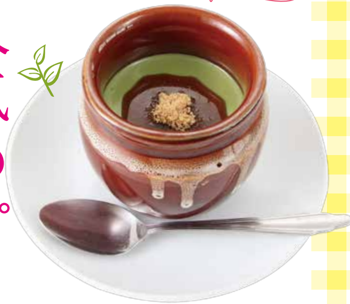
季節のプリン 抹茶プリン