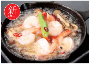
061 エビのアヒージョ 800円(税込880円)