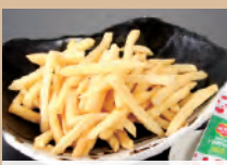
076 ポテトフライ 446円(税込490円)