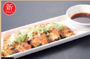
068 ニラだく揚げチヂミ 691円(税込760円)