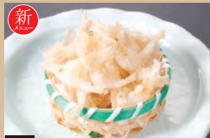
070 白エビの唐揚げ 391円(税込430円)