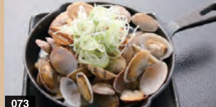
073 アサリの酒蒸し 628円(税込690円)