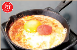
069 とうろふわとろ焼き 591円(税込650円)