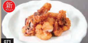
071 タコの唐揚げ 491円(税込540円)