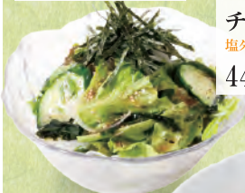
067 チキチキサラダ (チキンシーザーサラダ) シーザードレッシング 628円(税込690円)