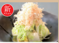
078 白菜の浅漬け 391円(税込430円)