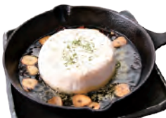
062 丸ごとカマンベールのアヒージョ 900円(税込990円)