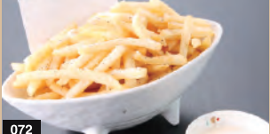
072 チーズちしょうポテトフライ 519円(税込570円)